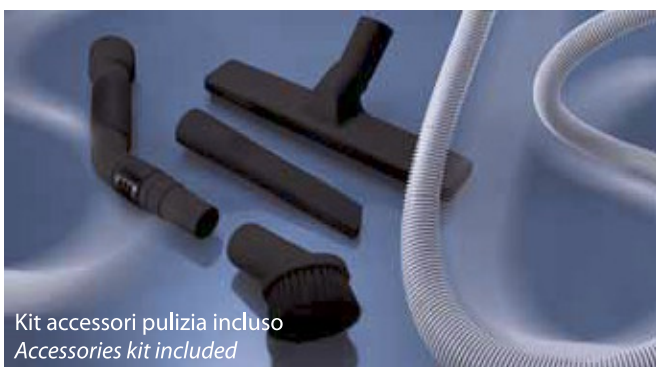
Kit accessori pulizia incluso Accessories kit included